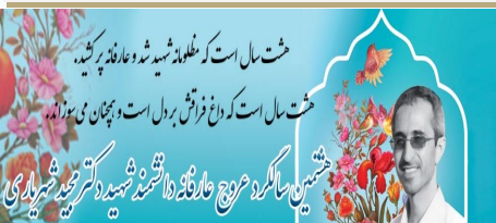
هشتمین سالگرد شهادت شهید راه علم، شهید دکتر مجید شهریاری