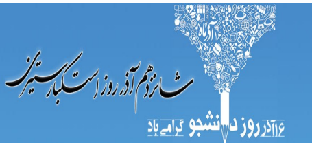
۱۶ آذر، روز دانشجو بر دانشجویان گرامی باد.